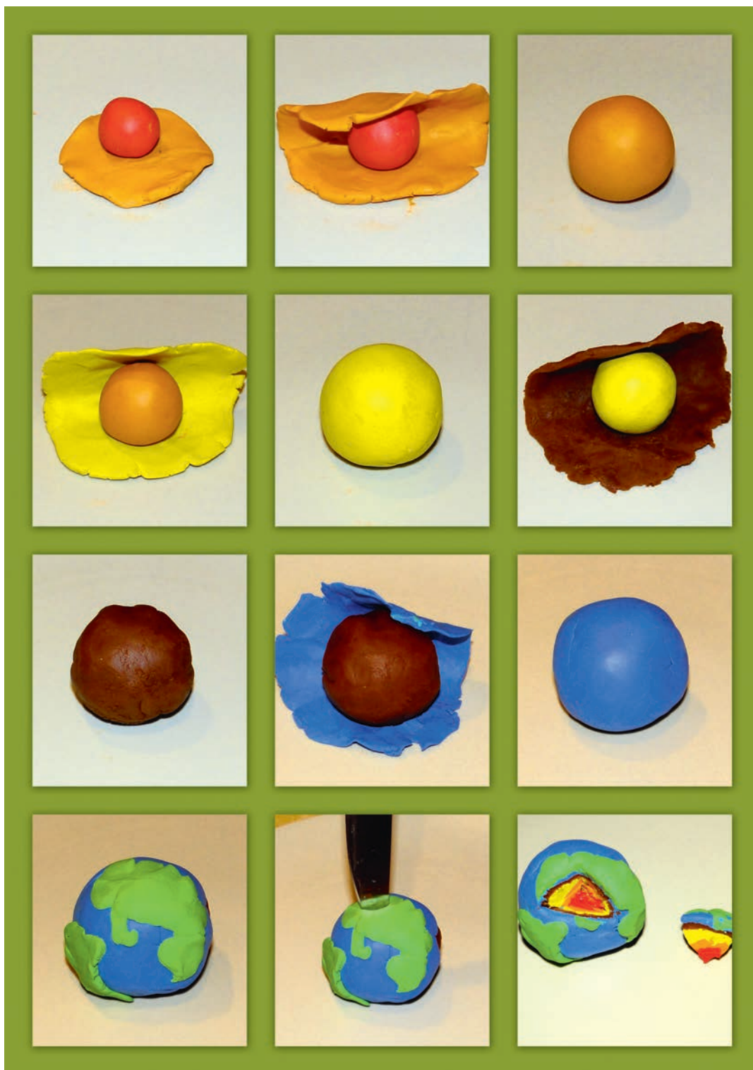
Modelul structurii Pământului realizat din plastilină