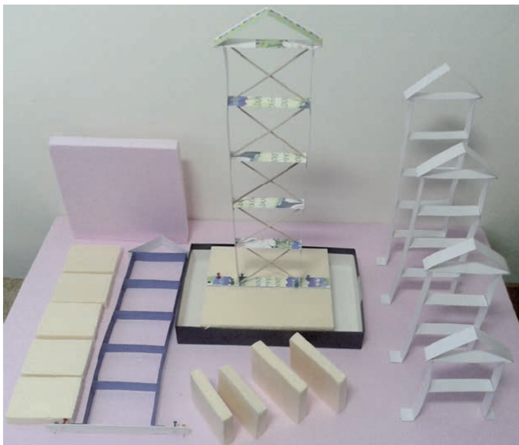
Exemple de modele cu dimensiuni și regim de înălțime diferite