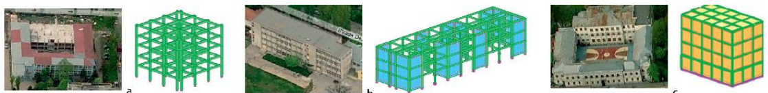
a. Schelet din beton armat b. Structură mixtă c. Pereți structurali

Din punct de vedere structural, dintre clădirile destinate învățământului primar, gimnazial și liceal, distingem: a. clădiri cu schelet din beton armat; b. clădiri cu structură mixtă: schelet și pereți structurali; c. clădiri cu pereți structurali (din beton armat sau din zidărie de cărămidă).